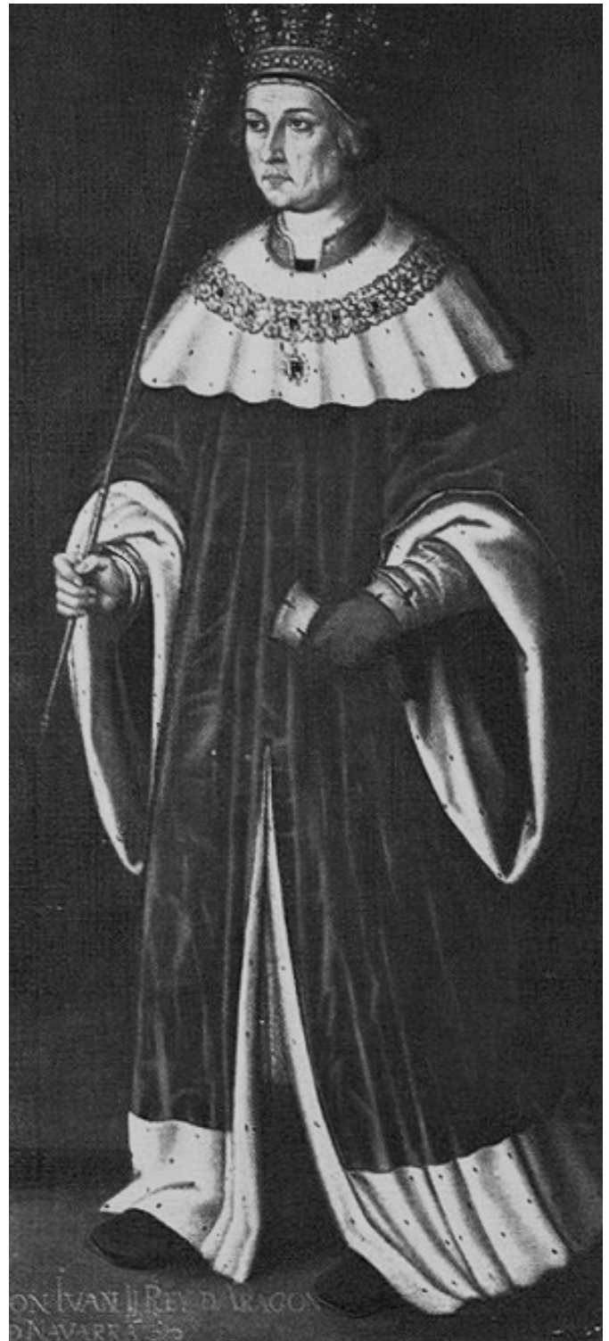
Il·lustració: Joan II d'Aragó, obra de Rolan de Mois, segona meitat del s. XVI

En aquesta guerra, considerada com de les últimes guerres medievals, s'enfrontaren per una banda el